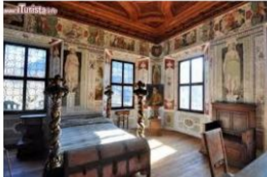
Palazzo Vertemate Franchi di Chiavenna

Evento connesso alle manifestazioni per il 4° centenario della frana di Piuro 1618-2018