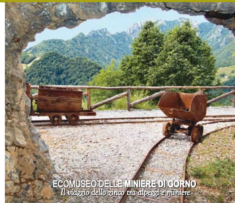
ECOMUSEO DELLE MINIERE DI GORNO Il viaggio dello zinco tra alpeggi e miniere